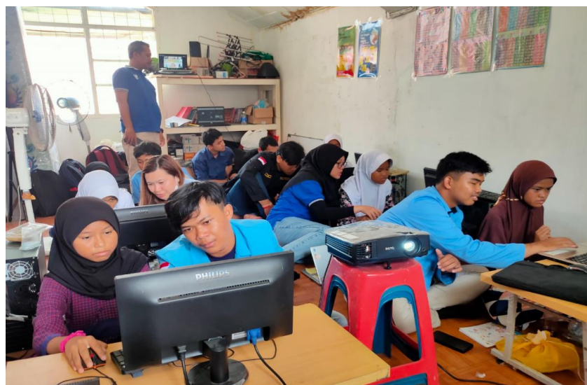
Gambar 1 Peserta Pengabdian Masyarakat diajarkan mendesign dengan aplikasi canva

Lebih jauh lagi, poster edukasi yang dihasilkan oleh peserta menjadi instrumen untuk meningkatkan kesadaran masyarakat terhadap isu-isu pendidikan. Dengan menggambarkan nilai-nilai kepahlawanan dalam desain mereka, anak didik KOPPAJA tidak hanya menyampaikan pesan-pesan positif tetapi juga mengajak masyarakat untuk bersama-sama mendukung perkembangan pendidikan. Poster-poster ini menjadi sarana untuk merangkul dukungan dan partisipasi masyarakat dalam upaya meningkatkan kualitas pendidikan. Sebagai hasilnya, pelatihan Canva bukan hanya memberikan manfaat bagi peserta secara individu, tetapi juga berkontribusi pada pembentukan masyarakat yang lebih sadar dan aktif terhadap isu-isu pendidikan. Dengan dukungan dan partisipasi yang meningkat dari masyarakat, potensi untuk perubahan positif di sektor pendidikan menjadi semakin besar. Pelatihan ini, dengan demikian, bukan hanya sebuah acara pelatihan, melainkan sebuah inisiatif yang memberdayakan individu dan komunitas untuk membentuk masa depan pendidikan yang lebih baik. Penting untuk diingat bahwa pelatihan Canva bukanlah solusi umum untuk masalah akademis anak didik KOPPAJA, dan dapat menjadi alat yang efektif dalam upaya mereka. Penelitian ini memberikan panduan dan inspirasi bagi komunitas lain dan organisasi nirlaba yang berupaya mengatasi permasalahan serupa di lingkungan komunitas berbeda.