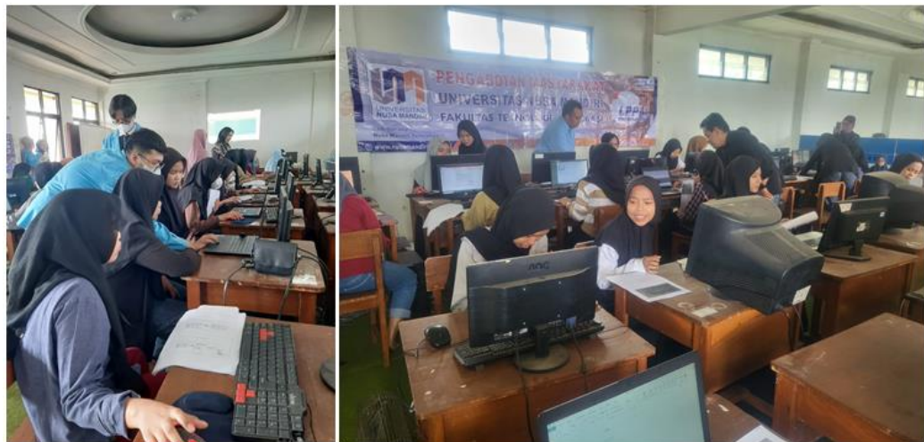
Gambar 5 Penyalpian Materi oleh Dosen dan Mahasiswa