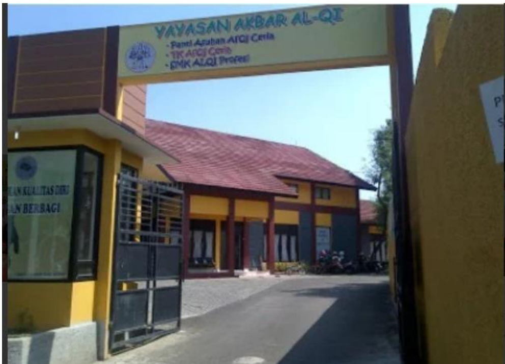
Gambar 1 Gedung Yayasan Akbar Alqi

Kegiatan Pengabdian Kepada Masyarakat merupakan salah satu kegiatan yang wajib bagi seorang dosen, sebagai bentuk kepedulian kepada masyarakat sekitar yaitu dengan melaksanakan kegiatan tersebut secara offline/luring berupa pelatihan di bidang ilmu teknologi khususnya dalam mengaplikasikan komputer untuk membantu memotivasi, menambah pengetahuan dan ketrampilan anak-anak asuh Panti Asuhan Alqi Ceria, sehingga diharapkan dapat mengatasi permasalahan yang ada sering dihadapi oleh Panti Asuhan Alqi Ceria agar data-data tersebut dapat tersimpan dengan rapi dalam suatu aplikasi (E. Z. L. Astuti & T. Winarni, 2018).